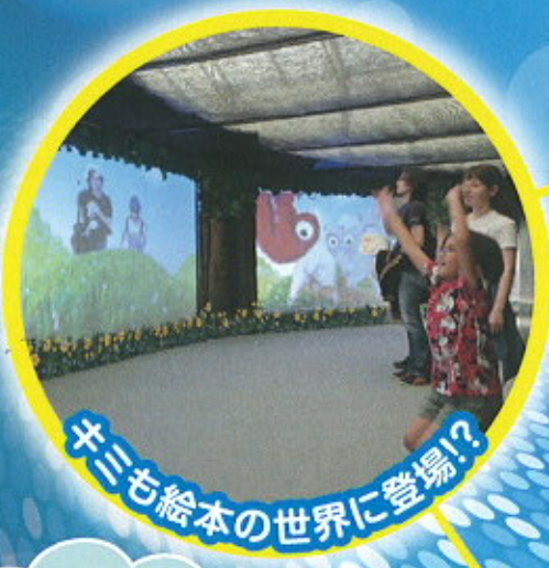
キミも絵本の世界に登場!?