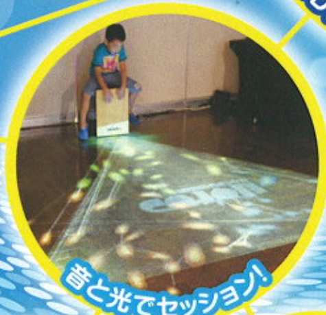
音と光でセッション!