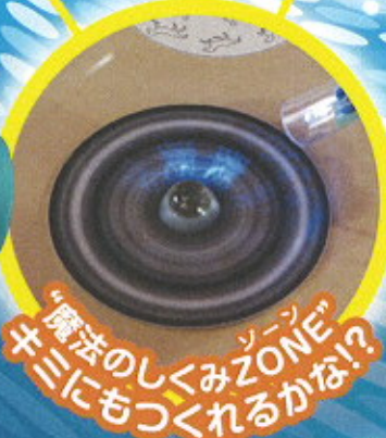
魔法のしくみZONE! キミにもつくれるかな!?