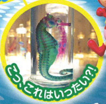
さ、これはいったい?!