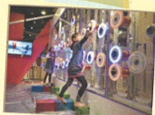
10階 はらはらウォール

自分のからだをつかって科学を体感できる約50種類の展示物があるほか、土日や長期休暇には楽しい・学べるイベントがもりだくさん! 遊びながら科学のふしぎを体験しよう!