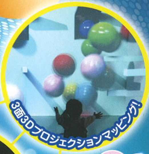
3面3Dプロジェクションマッピング!