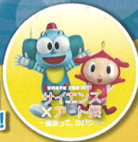
サイエンス ×アート展 魔法って、カガク!