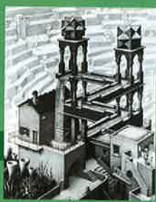
M.C. エッシャー (海) 1961年、リトグラフ © M.C. Escher, www.escher.com © The M.C. Escher Company www.mcescher.com