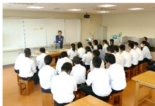
《創作ルーム利用時の様子》