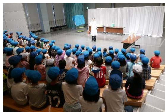
《イベントホール利用時の様子》