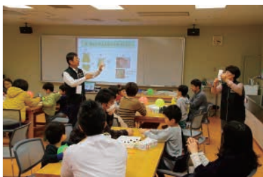
しずおか科学コミュニケーター倶楽部 「ゴムのふしぎ」

※出展希望が多かった場合は会場を変更する場合（イベントホール）がありますので、あらかじめご了承ください。