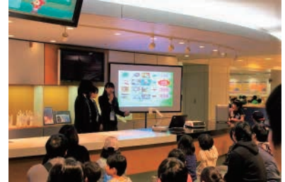
静岡北中学校・高等学校 「カメラについて見て、触れて学んでみよう！」