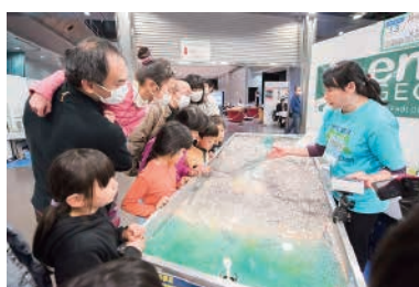
リトルリバーリサーチ&デザイン