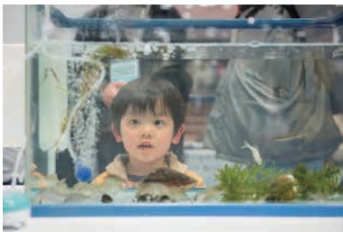
静岡ガス株式会社 静岡支社