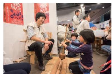
静岡市立登呂博物館