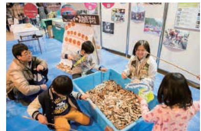
ホールアース研究所