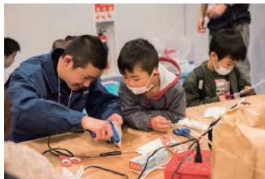
静岡県立焼津水産高等学校