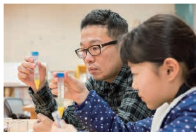
くらしとバイオプラザ21・三菱化学テクノリサーチ 「日本のカンキツ産業を支える！品種改良の新旧あれこれ」