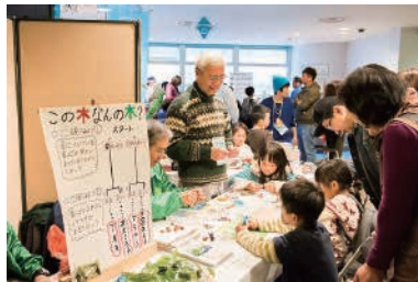
森林インストラクターしずおか