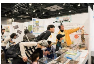
磐田市竜洋昆虫自然観察公園