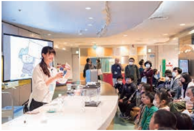
箱根ジオミュージアム 「火山の噴火実験をしよう！」

※ステージで発表している際は、ブースを空けて構いません。安全面で問題がある場合は科学館スタッフが巡回します。