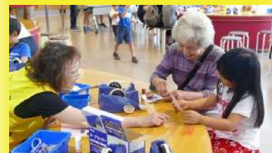
る・く・るナビゲーター活動の様子